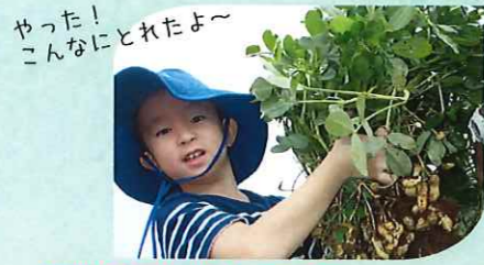
やった！こんなにとれたよー 【重要】食物アレルギーについて 食物アレルギーのある方は、お申込み前にご相談ください。

収穫体験として、「食」について考えます。土に触れて農家の人の苦勞を知る機会となり、収穫したての落下生とさつまいもは、おやつになり、残った分は「おみやげ」になります！